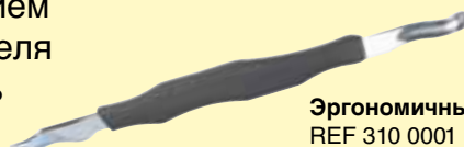
Эргономичный шпатель REF 310 0001 3

Восковая моделировка легко и быстро выполняется с использованием эргономичного шпателя и приобретает очень естественный вид.