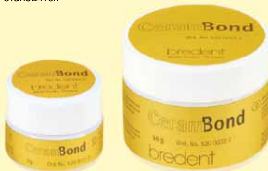
Церам-Бонд 7 гр REF 520 0032 3

Церам-Бонд действует как амортизатор при различных коэффициентах термического расширения металла и керамики. Внутренние напряжения между металлом и керамикой становятся значительно меньше.